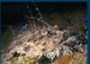
17/O - rana pescatrice