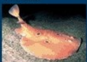
17/A - torpedine ocellata