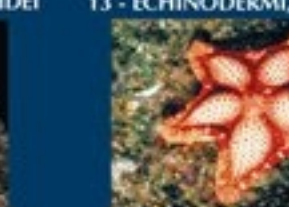
13/A - stella pentagono