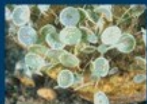
1/A - ombrellino di mare