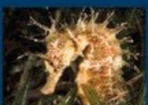
17/E - cavall. ramuloso