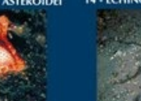
14/A - stella serpentina liscia