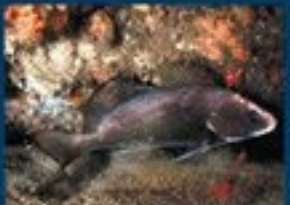
17/I - corvina