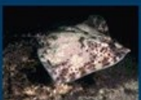
17/B - razza chiodata