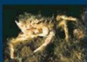
9/C - granceola