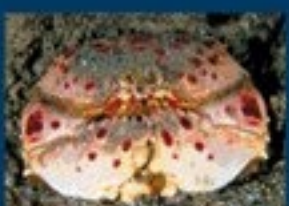
9/D - granchio melograno