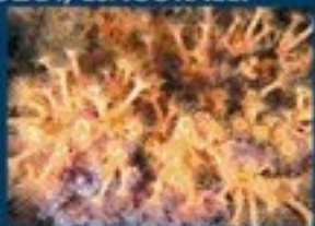
4/B - margherita di mare