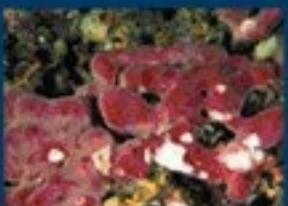
2/B - petrosia