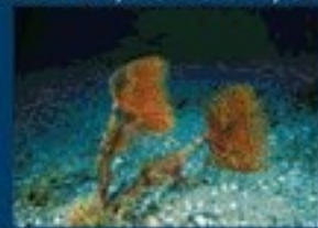
5/A - spirografo