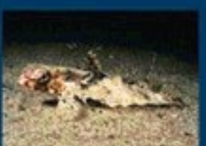
17/G - pesce civetta