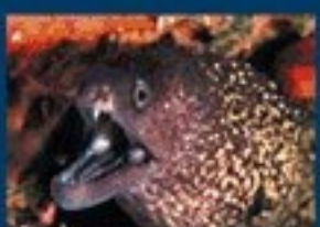
17/C - murena