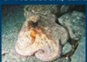
8/A - polpo comune