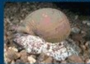
6/A - doglio