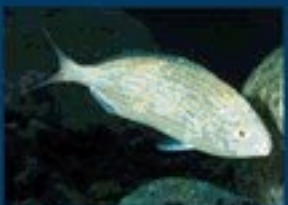
17/L - salpa