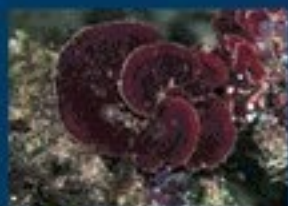
1/B - rosa di mare