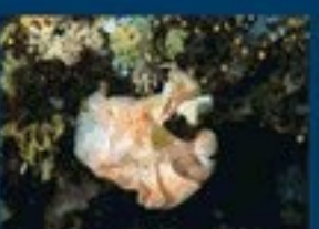
10/B - trina di mare