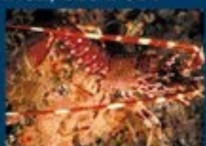
9/B - aragosta