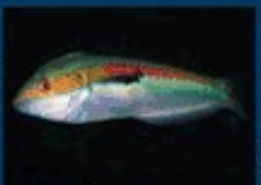
17/N - donzella