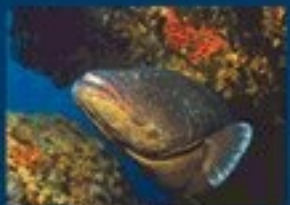
17/H - cemia bruna