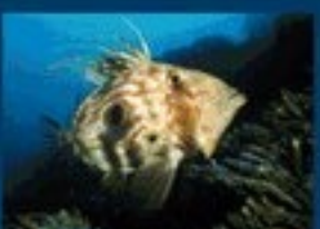
17/D - pesce San Pietro