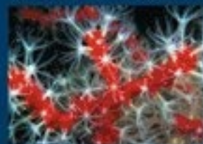
3/A - corallo rosso