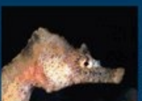
17/F - cavall. camuso