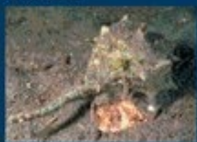
6/B - murice spinoso