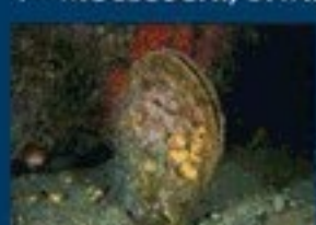
7/A - pinna