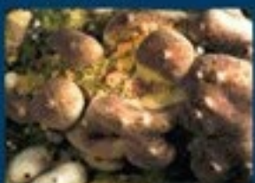
2/A - condrilla