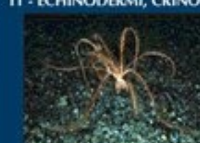
11/A - giglio di mare