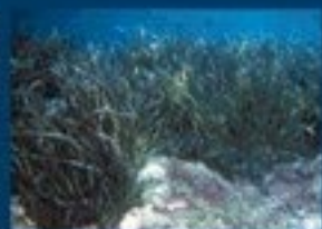
1/C - posidonia