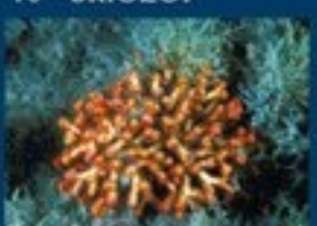
10/A - falso corallo