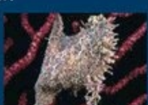
7/B - ostrica alata