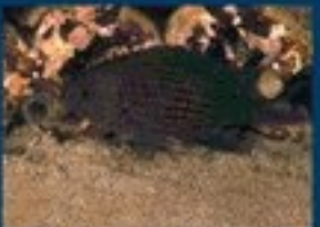
17/M - castagnola