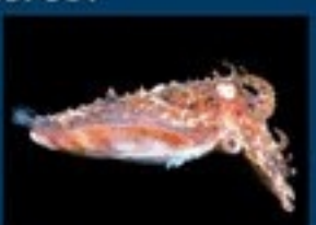
8/B - seppia