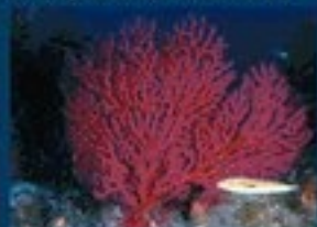
3/B - gorgonia rossa