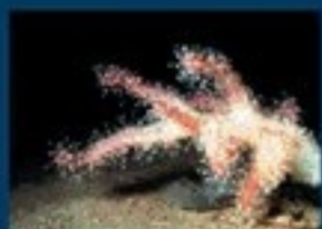
3/C - mano di San Pietro