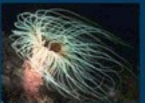
4/C - ceriario