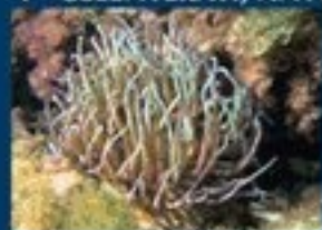
4/A - anemone di mare