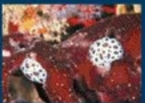
6/C - vacchetta di mare