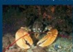
9/A - astice