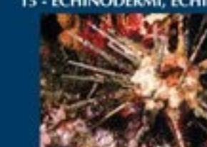
15/A - riccio saetta