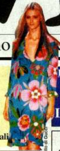
Un modello di Gucci

IN SEGUITO AL MANCATO ACCORDO CON PINAULT, I CUI TITOLI PERDONO IL 4,82%