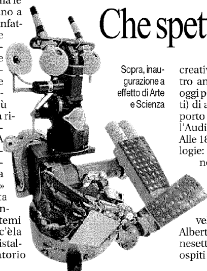
Sopra, inaugurazione a effetto di Arte e Scienza